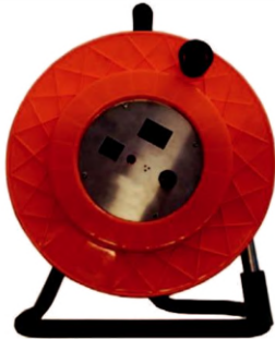
Деталь зонда магнитного детектора