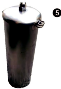
Детали крышки подвеса